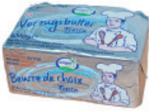
Vorzugsbutter Nr. 3115, L: 10x1 kg, P/kg: 12.60