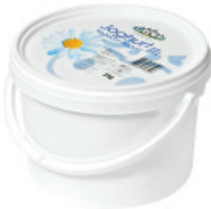
Joghurt Nature Nr. 3112, L: 3 kg, P/kg: 2.83, P/Bidon: 8.50