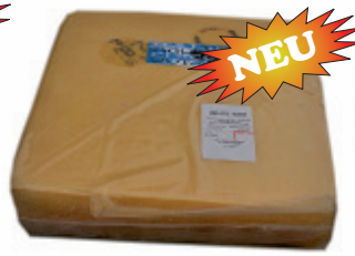
Raclette Switzerland, eckig 45% F.i.T. (ganzer Laib ca. 6–7 kg) Nr. 3300, P/kg: 10.85