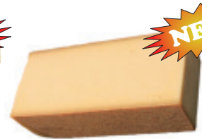
Gruyère AOC mild 48% F.i.T. (Riemen, ca. 2 kg) Nr. 3566, Tagespreis