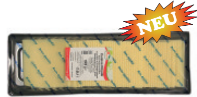
Käsescheiben nature 40–42% F.i.T. Wiederverschliessbare Packung Nr. 3562, L: 50x20 g, P/kg: 9.90