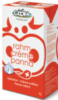
Vollrahm UHT 35% Fettgehalt Nr. 3102, L: 12x1 lt, P/Stk: 6.24, P/K: 74.88