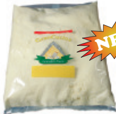
Gran Cucina (frisch geriebener Hartkäse) 45–50% F.i.T. Nr. 3563, L: 6x1 kg, P/kg: 10.90