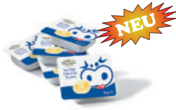
Butter Portionen Nr. 3114, L: 96x10 g, P/K: 18.90