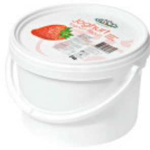
Joghurt Erdbeer Nr. 3113, L: 3 kg, P/kg: 3.27, P/Bidon: 9.80