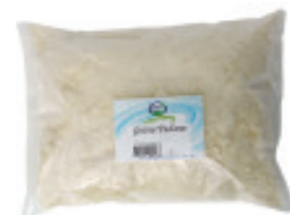
Grana Padano Nr. 2092, L: 10x1 kg, P/kg: 17.44, P/K: 174.40