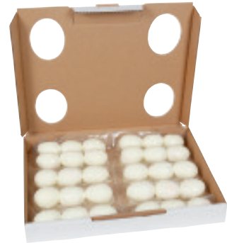
Traiteur-Eier Freilandhaltung EU L: 10x3 Stk im Karton Nr. 2951, P/Stk: 0.51, P/K: 15.30