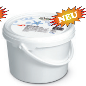
Cottage Cheese (Hüttenkäse) Nr. 3625, L: 2,5 kg, P/kg: 16.90, P/Bidon: 42.25