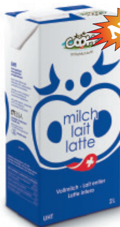
Vollmilch UHT 3.5% Fettgehalt Nr. 3276, L: 12x2 lt, P/Stk: 1.29, P/K: 15.48