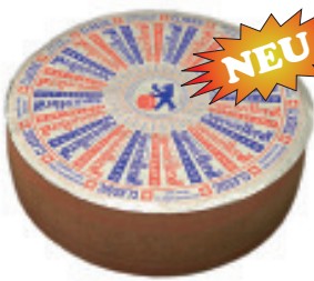
Appenzeller Classic 50% F.i.T. (ca. 7 kg) Nr. 3567, Tagespreis