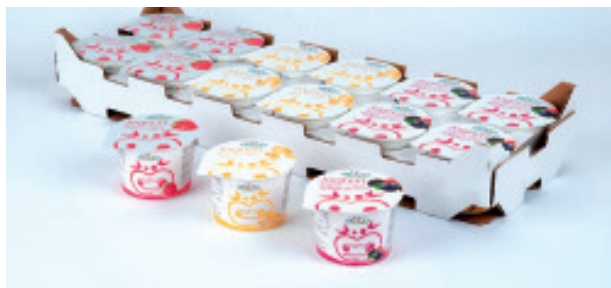
Joghurt assortiert Nr. 3204, L: 12x90 g, je 4x Himbeer, Banane, Waldbeer P/Stk: 0.55, P/K: 6.60