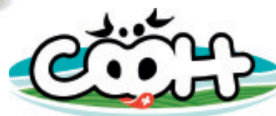
Joghurt Mocca stichfest, Nr. 3110, L: 6x150 g, P/Stk: 0.58, P/K: 3.48