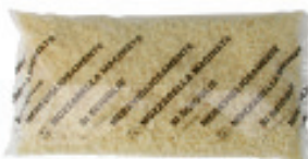
Mozzarella Züger gewürfelt 42% Nr. 2070, L: 5x2 kg, P/kg: 7.70, P/K: 77.00