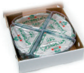
Gorgonzola 4/4, ca. 6 kg Nr. 2091, L: ca. 6 kg, P/kg: 14.21, P/K: ca. 85.25