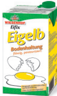
Eigelb flüssig, pasteurisiert Bodenhaltung EU, Eifix Nr. 2948, P/kg: 9.70