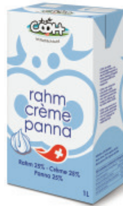
Halbrahm UHT 25% Fettgehalt Nr. 3103, L: 12x1 lt, P/Stk: 5.95, P/K: 71.40