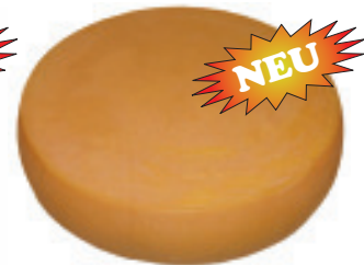
Fontal 45% F.i.T. (Laib ca. 6,5 kg) Nr. 3569, P/kg: 9.50