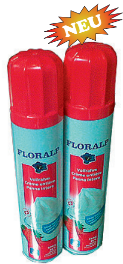
UHT Vollrahm 35% Fett ohne Zucker Nr. 3427, L: 6x500 g, P/Dose: 7.32, P/L: 43.92