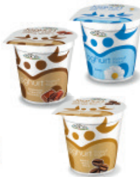
Joghurt Nature stichfest, Nr. 3111, L: 6x150 g, P/Stk: 0.53, P/K: 3.18