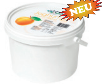
Joghurt Aprikose Nr. 3196, L: 3 kg, P/kg: 3.27, P/Bidon: 9.80