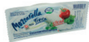
Mozzarella Stange geschnitten «Fresca» Nr. 2077, L: 5x400 g, P/Stk: 5.97, P/K: 29.85