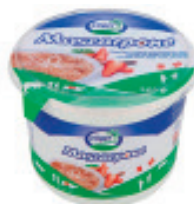
Mascarpone «Züger» Nr. 2090, L: 6x500 g, P/Stk: 5.89, P/K: 35.34