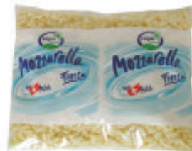
Mozzarella Züger «Fresca» gewürfelt 45% Nr. 2093, L: 5x2 kg, P/kg: 8.70, P/K: 87.00