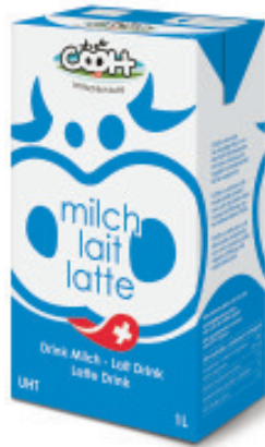
Milchdrink UHT 2.5% Fettgehalt, teilentrahmt Nr. 3101, L: 12x1 lt, P/Stk: 1.39, P/K: 16.68