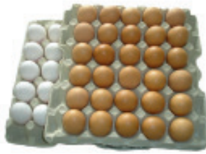
Import-Eier, weiss/braun 63 g+ , Bodenhaltung Nr. 2962, L: 360 Stk im Karton P/Stk: 0.32, P/K: 115.20