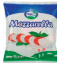
Mozzarella Kugel «Züger» Nr. 2074, L: 2x(5x150 g), P/Stk.: 2.02, P/K: 20.20