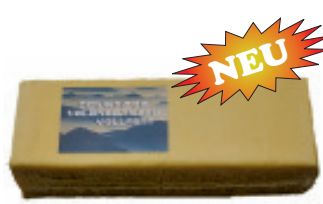
Frühstückskäse Stange 48% F.i.T. (ca. 2,6 kg) Nr. 3303, P/kg: 9.15