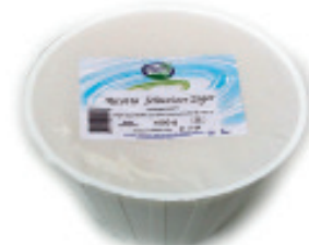
Ricotta «Fresca» Nr. 2079, L: 4x1,5 kg, P/Stk: 14.77, P/K: 59.08