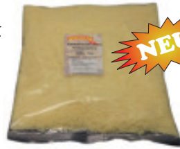
Reibkäsemischung Emmentaler/Gruyère 48% F.i.T. Nr. 3564, L: 10x1 kg, P/kg: 12.75