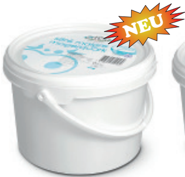
Magerquark Nr. 3430, L: 3 kg, P/kg: 11.80, P/Bidon: 35.40