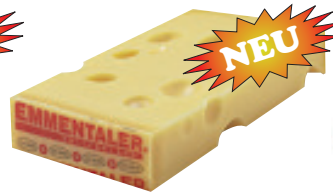
Emmentaler mild 48% F.i.T. (Riemen, ca. 3 kg) Nr. 3565, Tagespreis