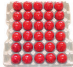
Schweizer Eier, PicNic gekocht, 60 g+ , Bodenhaltung L: 60 Stk im Karton Nr. 2944, P/Stk: 0.64, P/K: 38.40