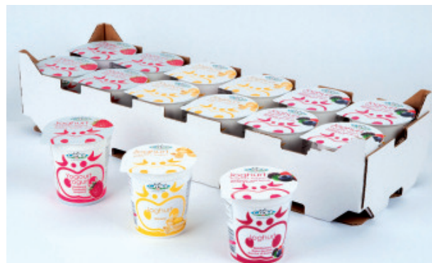
Joghurt assortiert je 4x Himbeer, Banane, Waldbeer Nr. 3108, L: 12x150 g, P/Stk: 0.62, P/K: 7.44