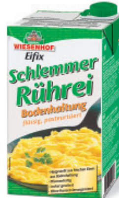
Rührei flüssig, pasteurisiert Bodenhaltung EU, Eifix Nr. 2949, P/kg: 6.50