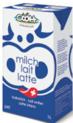
Vollmilch UHT 3.5% Fettgehalt Nr. 3100, L: 12x1 lt, P/Stk: 1.39, P/K: 16.68