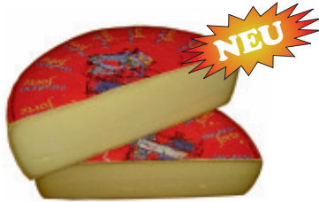
Bündner Bergkäse 45% F.i.T. (ganzer Laib, ca. 4,7 kg) Nr. 3304, Tagespreis