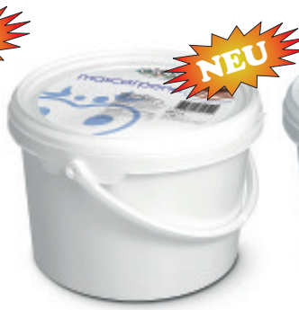
Mascarpone Nr. 3624, L: 2,5 kg, P/kg: 18.90, P/Bidon: 47.25