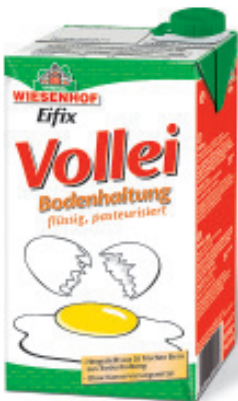
Vollei flüssig, pasteurisiert Bodenhaltung EU, Eifix Nr. 2946, P/kg: 6.30