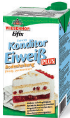
Eiweiss flüssig, pasteurisiert Bodenhaltung EU, Eifix Nr. 2947, P/kg: 5.20