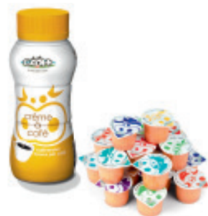
Kaffeerahm UHT Nr. 3105, L: 12x0.5 lt, P/Flasche: 2.30, P/K: 27.60