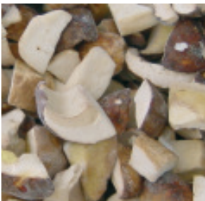
Steinpilze Stücke Nr. 1465, L: 1x5 kg, Tagespreis