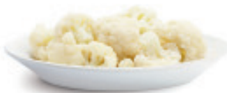
Blumenkohl 40/70 Nr. 1276, L: 2x2,5 kg, P/kg: 5.47, P/K: 27.37