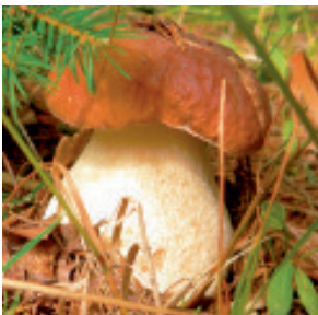
Steinpilze ganz extra Nr. 1469, L: 1x5 kg, Tagespreis