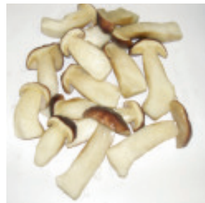
Steinpilze halbiert Nr. 1418, L: 5x1 kg, Tagespreis