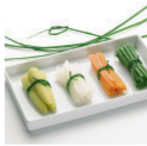
Bohnenbündchen Nr. 1451, L: 48x30 g, P/Stk: 0.67, P/K: 32.15 (nur auf Vorbestellung)