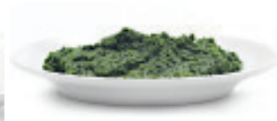
Spinat gehackt, Würfel Nr. 1304, L: 2x2,5 kg, P/kg: 3.21, P/K: 16.05