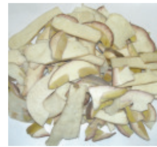
Steinpilze Scheiben Nr. 1454, L: 4x1 kg, Tagespreis