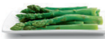
Spargeln grün Nr. 1303, L: 5x1 kg, P/kg: 11.26, P/K: 56.30