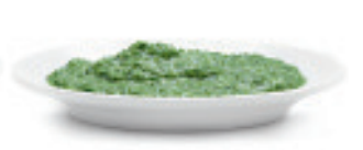
Rahmspinat in Würfel Nr. 1306, L: 2x2,5 kg, P/kg: 4.26, P/K: 21.30