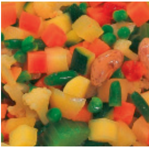
Minestrone Gemüsemischung Bohnen, Karotten, Sellerie, Kar- toffeln, Erbsen, Borlottibohnen, Zucchini, Lauch, Tomaten Nr. 1131, L: 2x2,5 kg, P/kg: 6.75, P/K: 33.75