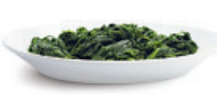
Blattspinat in Würfel Nr. 1305, L: 2x2,5 kg, P/kg: 4.68, P/K: 23.40