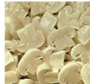
Champignons geschnitten Nr. 1321, L: 5x1 kg, P/kg: 5.60, P/K: 28.00