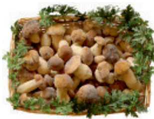
Steinpilze ganz Standard Nr. 1464, L: 1x5 kg, Tagespreis