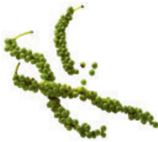
Pfeffer grün 1A Qualität Nr. 1456, L: 5x100 g, P/K: 41.60 (nur auf Vorbestellung)