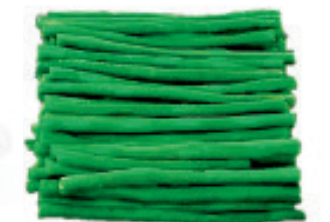
Chinabohnen Nr. 1764, L: 5x1 kg, P/kg: 7.26, P/K: 36.30